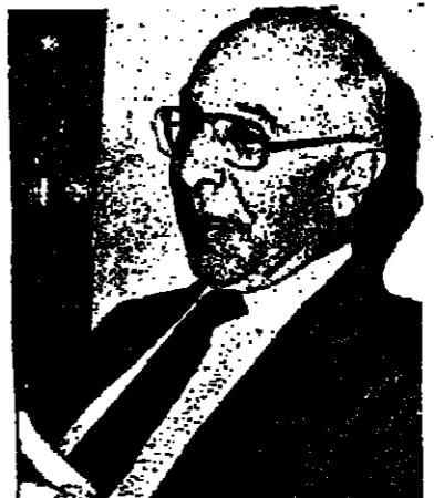
يقلم : سلام الراسي

هناك حكايات بنات حسب ونسب لها جذور عميقة في تاريخ تراثنا المرقى، وفيها خيال وجمال ودمعة، كما في بعض الأساطير، ولا سيما أن الذين صنفوها استعاروا أسماها وأدوار لبعض الآباء الأولين والأولياء الصالحين، في محاولة تسيير لبعض الظواهر والأسرار، فانصهروا عليها، بذلك، بسمة من الجد والوفاء.